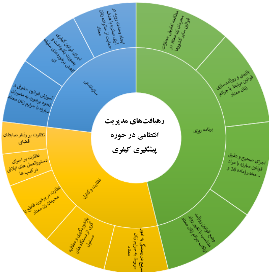
شکل ۳: رویافت‌های مدیریت انتظامی در حوزه پیشگیری کیفی

جرایم زنان معتاد همین بخش یعنی کنترل و نظارت مستمر و مداوم افراد است. در این راستا دو نوع نظارت و کنترل داریم. بخش اول نظارت و کنترل بر رفتار مأمورین و همچنین موضوع وحدت رویه در آرای صادره است به نحوی که صدور آرا با محوریت حمایت از خانواده مدنظر همه ارکان قضاوت قرار گیرد». در جمع بندی انجام شده، رویافت‌های مدیریت انتظامی در حوزه پیشگیری کیفی از جرائم زنان معتاد در شکل ۳ ارائه شده است.