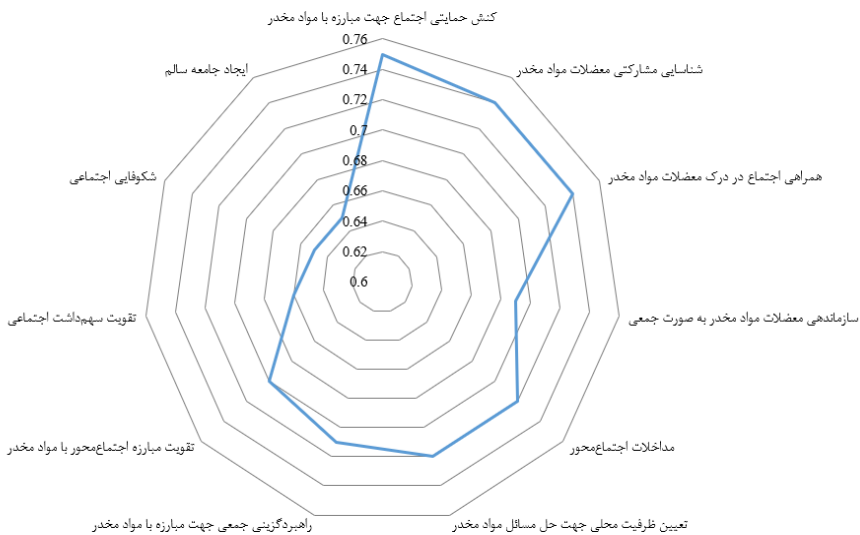
نمودار ۱: اولویت بندی پسا پندهای مبارزه اجتماع محور با مواد مخدر

با توجه به مقایسه نتایج دیدگاه‌های ارائه شده در مرحله اول و دوم، لازم به ذکر است در صورتی که اختلاف میانگین فازی زدایی شده در دو مرحله کم‌تر از ۰/۱ باشد، فرایند نظرسنجی متوقف می‌شود. همان‌گونه که ملاحظه می‌شود اختلاف میانگین فازی زدایی شده نظر خبرگان در دو مرحله از ۰/۱ کمتر است. بر این اساس، خبرگان در خصوص پیشایندها و پسایندهای مبارزه اجتماع‌محور با مواد مخدر به اجماع رسیدند و نظرسنجی در این مرحله متوقف شد. با توجه به آنچه گفته شد، اولویت تمامی عوامل در قالب نمودار ۲ و ۱ نشان داده شده است.