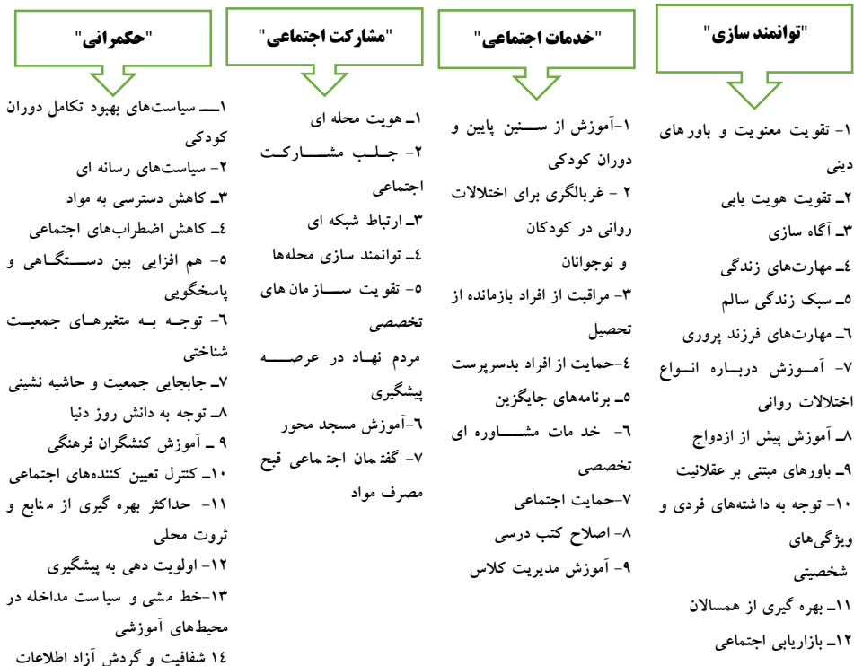
شکل ۱: عوامل چهارگانه و زیرمولفه‌های آن

راند دوم دلفی: مشخص نمودن اتفاق نظر خبرگان نسبت به ترتیب اهمیت عوامل تأثیرگذار بر مدیریت راهبردی پیشگیری اولیه از اعتیاد با رویکرد فرهنگی: در راند دوم و نیز راندهای بعدی، به منظور مشخص نمودن اتفاق نظر خبرگان نسبت به ترتیب اهمیت عوامل تأثیرگذار بر مدیریت راهبردی پیشگیری اولیه از اعتیاد با رویکرد فرهنگی، پرسش‌نامه ساخت یافته‌ای از عوامل چهارگانه و متغیرهای ذیل آن‌ها براساس طیف لیکرت ۱۰ درجه‌ای (صفر کاملاً مخالف تا ۹ کاملاً موافق) تنظیم و مجدداً برای ارزیابی در اختیار اعضاء خبرگان قرار گرفت. داده‌های استخراج شده براساس آمارهای توصیفی و ضریب هماهنگی کندال (W) در راستای دستیابی به اتفاق نظر و اطمینان نسبت به ترتیب اهمیت عوامل، مورد تحلیل قرار گرفت.