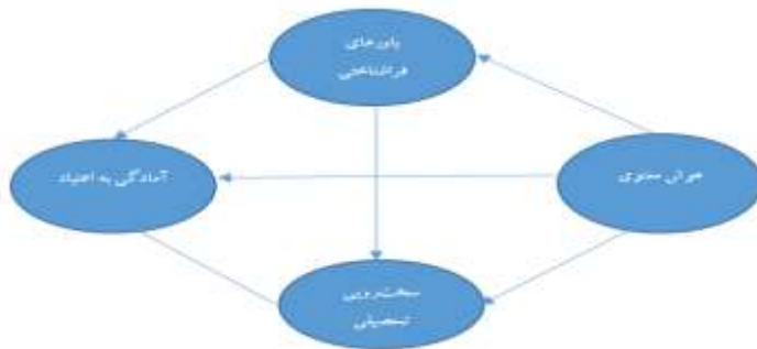
شکل ۱. مدل مفهومی ارتباط هوش معنوی با آمادگی به اعتیاد با میانجی‌گری باورهای فراشناختی و سخت‌رویی تحصیلی

انجام شده و به دنبال پاسخ به این سوال است که آیا هوش معنوی با میانجی‌گری باورهای فراشناختی و سخت‌رویی تحصیلی می‌تواند آمادگی به اعتیاد را در دانشجویان پیش‌بینی نماید؟ بررسی متغیرهای مذکور در این تحقیق به صورت مدل علی و اثرگذاری هر کدام در مدل پیشنهادی مطابق شکل (۱) می‌تواند به ایجاد دانش جدید در این حوزه کمک کند.